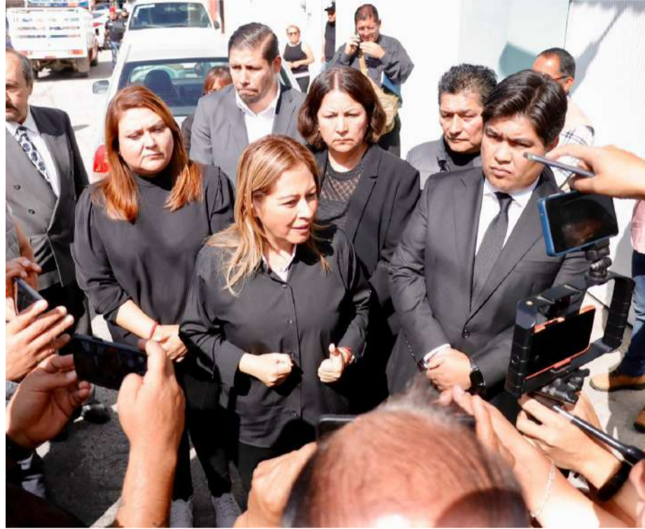
LUCÍA MEZA GUZMÁN

Derivado de la crisis de inseguridad que se vive en Morelos, la senadora Lucy Meza Guzmán se pronunció a favor de instalar de manera urgente una mesa de diálogo por la Seguridad, con el objetivo de cons-