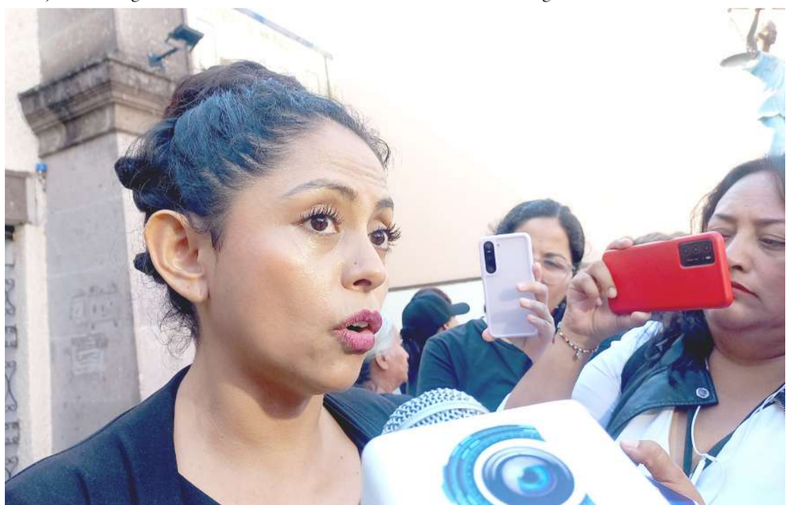
EL PRÓXIMO 2 DE junio en las elecciones locales, las candidatas a la gubernatura de Morelos sufrirán del voto de castigo de las mujeres, debido a que no atendieron una agenda de género destinada a atender la violencia feminicida, advirtieron feministas.

También solicitó a los demás aspirantes a un cargo de elección popular buscar a los colectivos feministas para realizar un trabajo coordinado en una agenda de género.