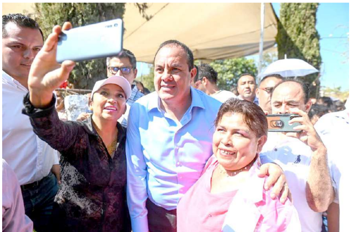
“HOY SE ESTÁN resolviendo las necesidades de la gente con trabajo coordinado, y quiero decirles que las libres transferencias me dan la oportunidad para poder hacer este tipo de obras de drenaje, que para ustedes son muy importantes, porque durante mucho tiempo estuvieron abandonados” indicó el gobernador Cuauhtémoc Blanco Bravo.