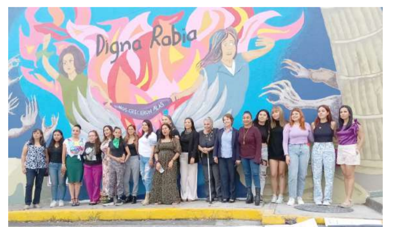
EN EL CAMPUS CHAMILPA de la UAEM, el colectivo “Las Morras contra la Violencia Institucional” develaron el mural “Digna Rabia”, para combatir la violencia contra la mujer, siendo un llamado urgente a la reflexión y acción en contra de esta problemática.