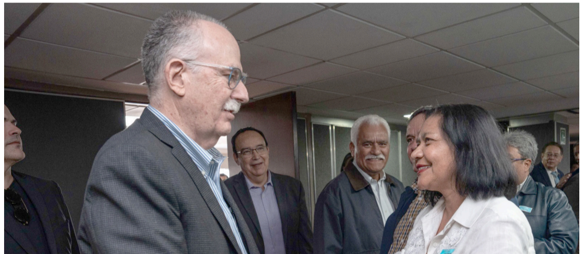
LA SECRETARIA DE Desarrollo Agropecuario del Gobierno de "La Tierra que nos une", Margarita Galeana Torres, participó en el encuentro que convocó el secretario de Agricultura y Desarrollo Rural, Julio Berdegué Sacristán, a los integrantes de la AMSDA.