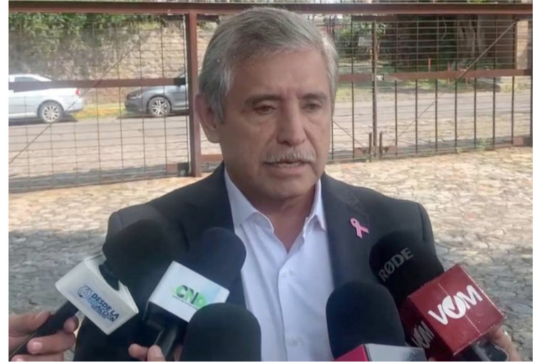
ASIMISMO, EL PRESIDENTE municipal consideró que varias de las víctimas de homicidio han sido aseguradas por la policía municipal en la comisión de diversos ilícitos.

Asimismo, el presidente municipal consideró que varias de las víctimas de homicidio han sido aseguradas por la policía municipal en la comisión de diversos ilícitos, y se ponen a disposición del Ministerio Público y no saben si este los vincula a proceso o los libera, pero es recurrente con que ya fueron privados de la vida. Por lo tanto, no hay un seguimiento a las investigaciones y no lleva a una eficacia en el tema de la seguridad.