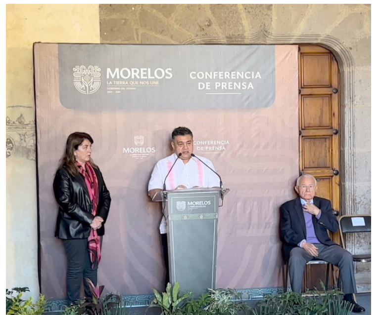
LA SECRETARÍA DE Seguridad y Protección Ciudadana, buscará combatir principalmente los delitos de extorsión y homicidios, ya que son los que más se registran en la entidad.

que no se tengan los amparos para evitar que se vaya teniendo esta situación, ayer en la noche dos de los homicidios fueron realizados al interior de un centro donde se expendían bebidas embriagantes y las personas fueron arrojadas a la cera cuando llegamos a esta situación”, concluyó Urrutia Lozano.